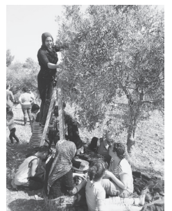
オリーブ収穫の様子

このプログラムは、オリーブ収穫のみならず、パレスチナの歴史や現状、難民キャンプ訪問、また、エルサレム旧市街地やベツレヘムの聖誕教会も訪れます。プログラムに参加した人たちは、パレスチナの人たちがおかれている状況を学び、そこでの日常生活を垣間見ることができます。私が見たパレスチナの市場は、さまざまな香辛料が並び、日用雑貨が所狭しと並べられ、人々が行き交い、歩く私たちとも挨拶が交わされます。確かに人々が暮らしています。その日常生活がいつ強制的に接収されるかわからない、私の想像を超える現状があります。12月初旬、国連総会でパレスチナが「国家」に格上げされた直後、イスラエルは入植計画を公示することを決めました。パレスチナの子どもたちに平和と希望が訪れるように、これからも継続して関心を持ち続けたいと思います。