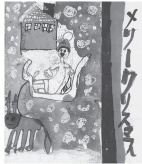
幼児の部 最優秀賞