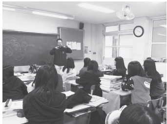
大田市チュンナム女子高校訪問

水原YMCAではとても興味深いプログラムがありました。「金融保険キャンプ」高校生(ハイY)対象のこのデイキャンプには大学生(学生YMCA)がボランティアとして参加していました。都市にあるYMCAが社会教育活動を通して高校生、大学生の活動を活発にし、新たな価値観や考えを育てているのです。