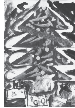
小学生の部 最優秀賞