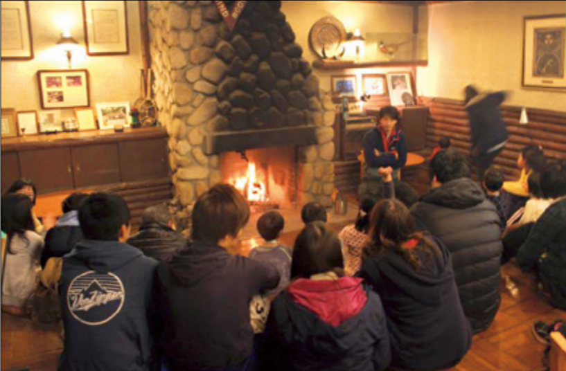
family camp at Rokko YMCA

「母子避難の状態でした。自主避難だから十分な支援もなかった。何より孤独だった。慣れない土地の生活、放射能に気を使う毎日、男の子の扱い