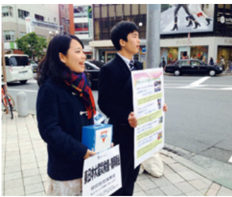
Fund raising Campaign

一言でいえば「しあわせでいてほしいから」が理由です。5年前の私はとても無力な高校生で、遠く離れた地から不安げに眺めていることしかできなかったのです。大学生になり被災地を実際に自分の目で見て、感じて、人々にふれて、すべてが自分事になりました。パートナーキャンプで出会った出会った子どもたちはどうしてるだろう、元気にしてるだろうか、一人ひとりのことを思い出します。誰もが家族や友人、恋人を想うように。