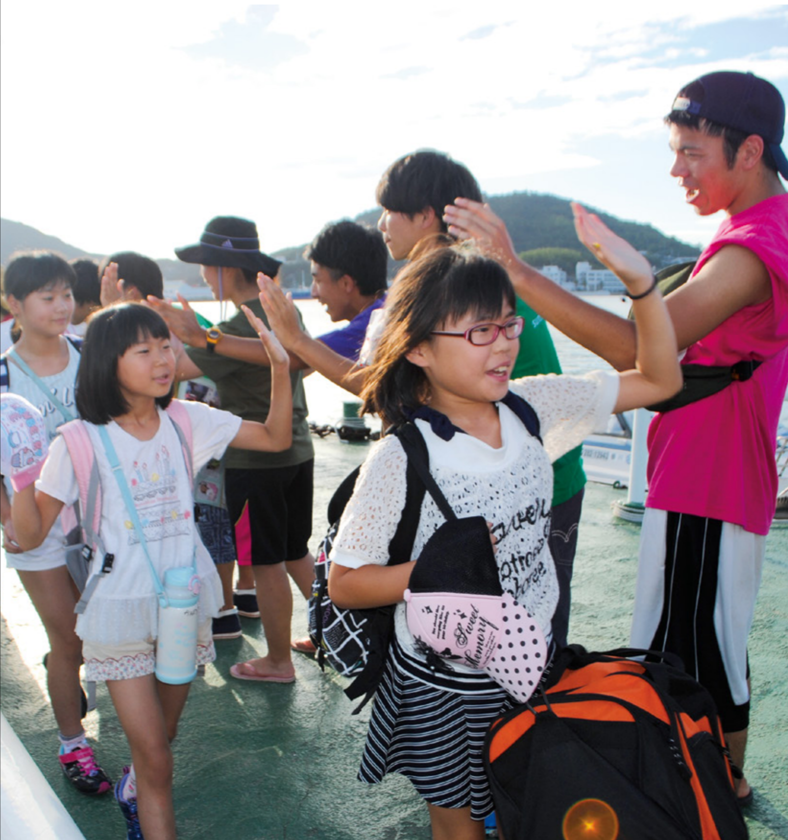
福島の子供を招待するキャンプ in 余島 YMCA invited children of Fukushima to Camp Yoshima