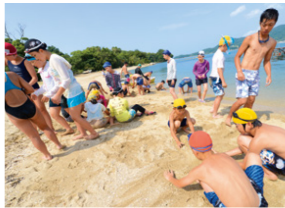
Camp Yoshima with Children of Fukushima

「やっぱり海にお世話になってるから、海の掃除をしたいんだ（2015夏）」とあるキャンパーが言った。これまでに無い発言だ。キャンプのテーマは「キャンプにおける一人ひとりの『責任』とは何か？」。キャンプアクティビティだけでなく、ディスカッションによって子どもたちを導いていく。これまでのシンプルな「リフレッシュキャンプ」から、自らが責任を持ってキャンプに関わり喜びを生み出していく「自