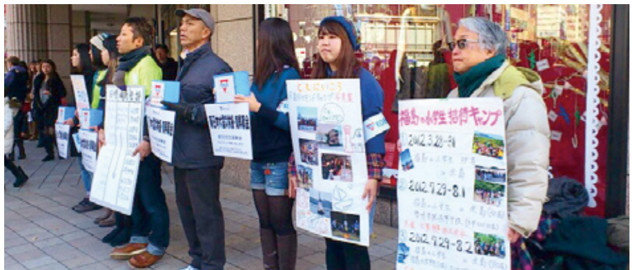
Fund raising Campaign

このキャンプは、福島に住む子どもたちに希望を与え続けてきたと思います。そしてこれからも希望を与え続け、仲間と共にこれからの福島を引っ張って