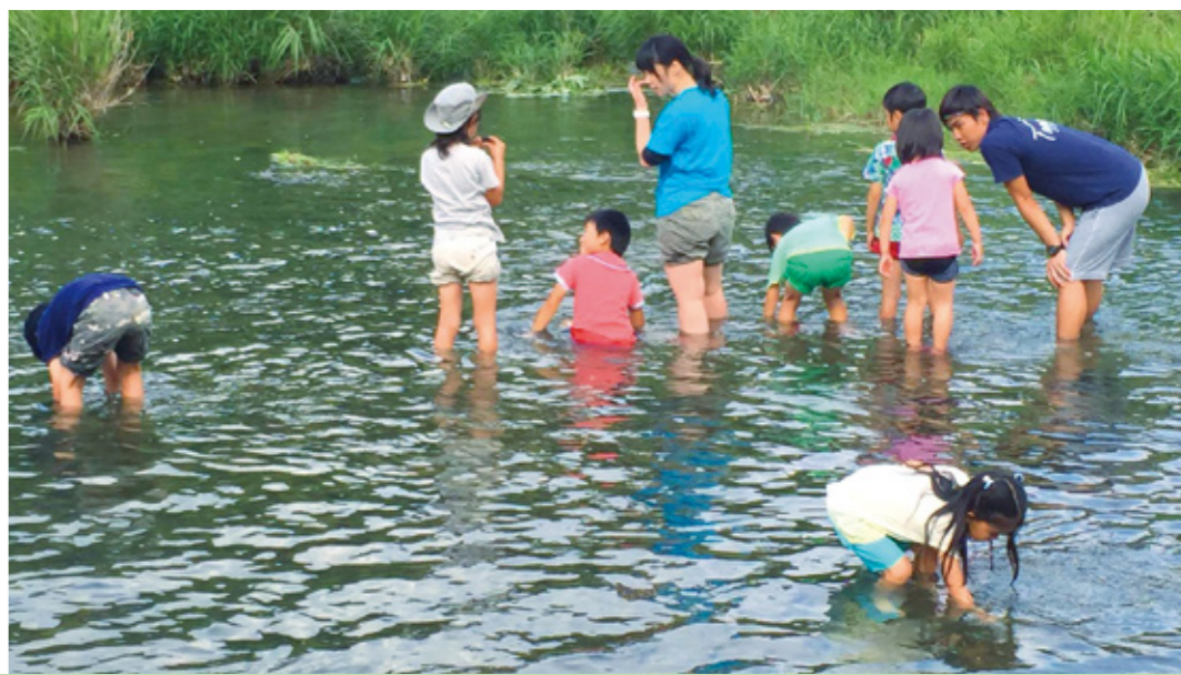
Family Camp Programs for earthquake evacuee families