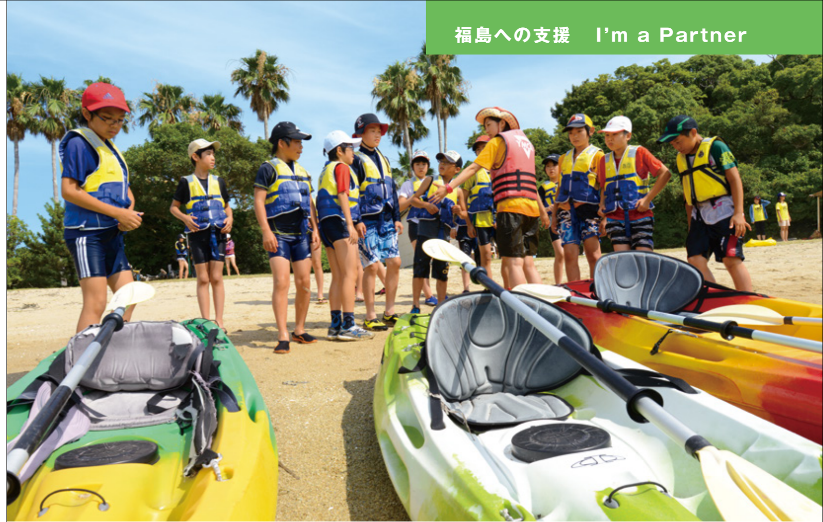
Children of Fukushima in Camp Yoshima